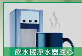
飲水機淨水器濾心