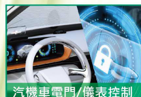
汽機車電門/儀表控制