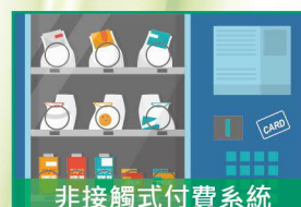
非接觸式付費系統